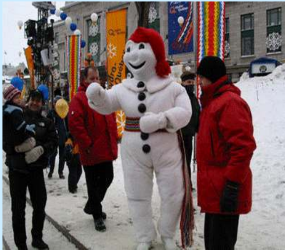
« Bonhomme de neige » à Québec...