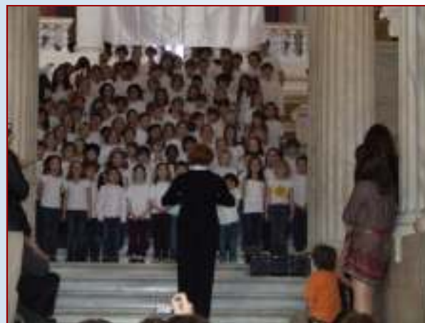
Des écoliers de l'École franco-américaine du RI chantent. Très mignon !