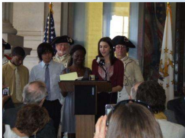
Des élèves de Classical HS récitent un poème sur la Francophonie (voir page 5).