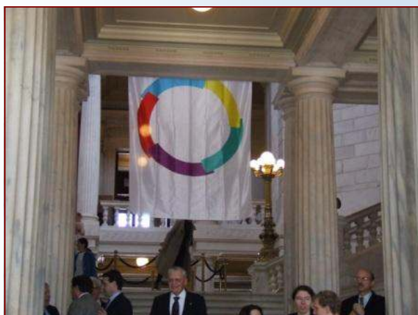
Drapeau de la Francophonie dans la Rotonde.