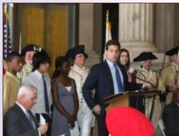
Le président de l'AATF-RI s'adresse au public.