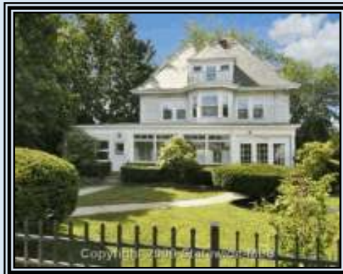
928 Smith Street Providence, RI

Voici la nouvelle maison dans laquelle l'Alliance devrait emménager pendant l'été. Ces dernières années, les activités proposées par l'Alliance ont été multipliées. Il y a désormais de très nombreux clubs. La chorale se réunit de manière hebdomadaire et vous permet de chanter en français. L'Alliance comique travaille chaque année sur plusieurs pièces de théâtre ; cette année Georges Feydeau a été à l'honneur. Le Cercle de lecture se réunit tous les mois et demi afin de discuter du dernier roman contemporain lu par le groupe. Le Gourmet club se réunit périodiquement autour d'un chef pour préparer de bons petits plats. Le Club de conversation invite tous les premiers lundi du mois une personne francophone afin de faire une petite présentation qui est la source de la discussion qui s'en suit.