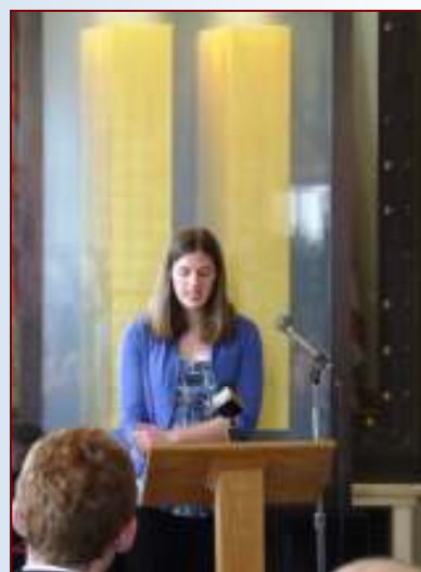
Les élèves de français de East Providence HS présentent le poème «Liberté» du poète français Paul Éluard.