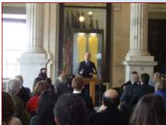
M. le Consul Général de France à Boston s'adresse au public.