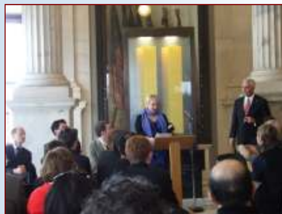
La directrice de la FASRI s'adresse au public.