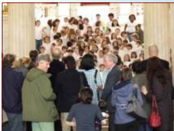
Le chorale de la FASRI dans la Rotonde du Capitole.