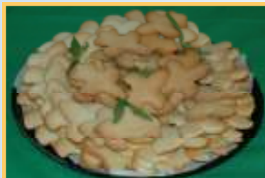
Biscuits «fleur de lys» de la réception !