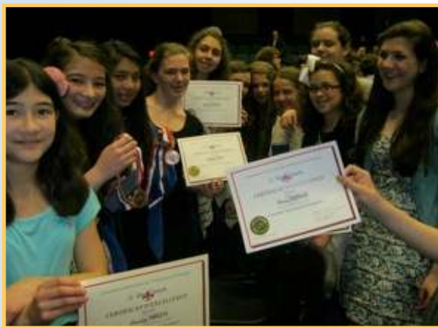
Les lauréats !