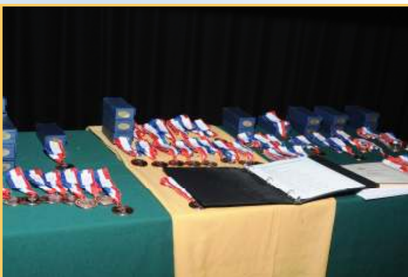
Les Prix du Grand Concours