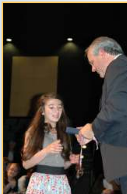
Administrateur du Grand Concours présente un prix à une élève.