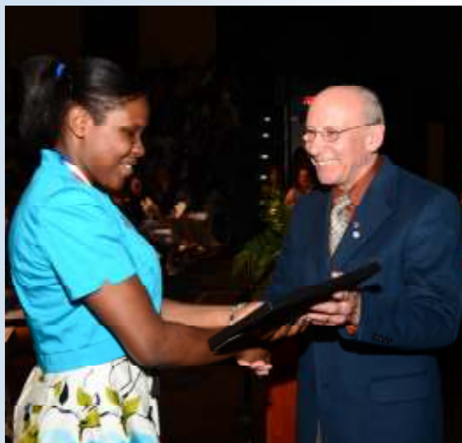
Le Vice-président du Club Richelieu Normand Desmarais présente un prix à une élève.