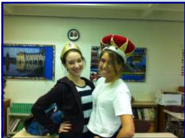
La Fête des Rois 2012, East Greenwich HS