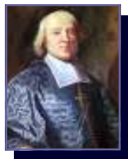
Jacques Bénigne Bossuet (1627-1704)

« Les vraies études sont celles qui apprennent les choses utiles à la vie humaine »